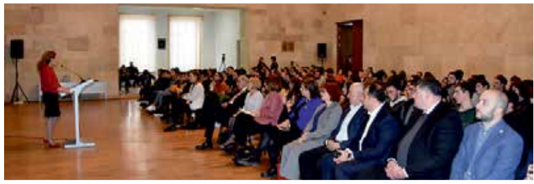
ოკუპირებულ რეგიონებში მცხოვრები აბიგურეინგებისათვის განკუთვნილი პროგრამის პრეზენტაცია თსუ-ში

თბილისის სახელმწიფო უნივერსიტეტისა და ზუგდიდის შოთა მესხიას სახელობის უნივერსიტეტში უფასო მოსამზადებელი ცენტრი შეიქმნება, რომელიც საქართველოს ოკუპირებულ ტერიტორიებზე მცხოვრები აბიგურეინგების ერთ-ერთი გამოცდისთვის მოამზადებს. ამის შესახებ შეთანხმების დასრულების შემდეგ თანხა თბილისის სახელმწიფო უნივერსიტეტსა და თსუ-ს შორის დაიდგინდება.